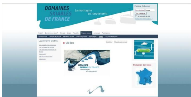
La Carte de Visite de Domaines Skiables de France