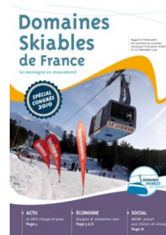
DSF25 Novembre 2010