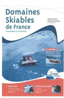
DSF26 Février 2011