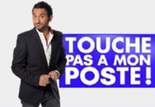
Présenté par Cyril Hanouna