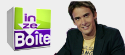
Présenté par JOAN