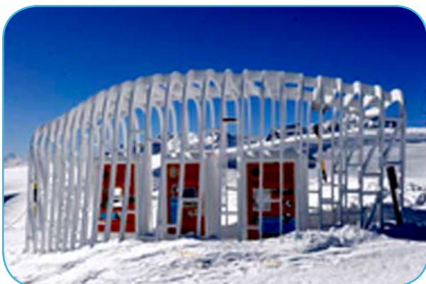
Mise en scène sur le domaine skiable de Serre Chevalier sur le thème de la neige de culture